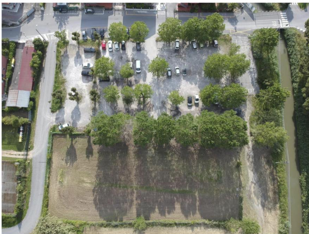
Vista aerea dell'area oggetto di intervento

Opere di riqualificazione, adeguamento, attualizzazione e realizzazione di manufatto servizi, relativamente all'area destinata a parcheggio di uso pubblico e sita in località Fiumaretta, Via Baban.